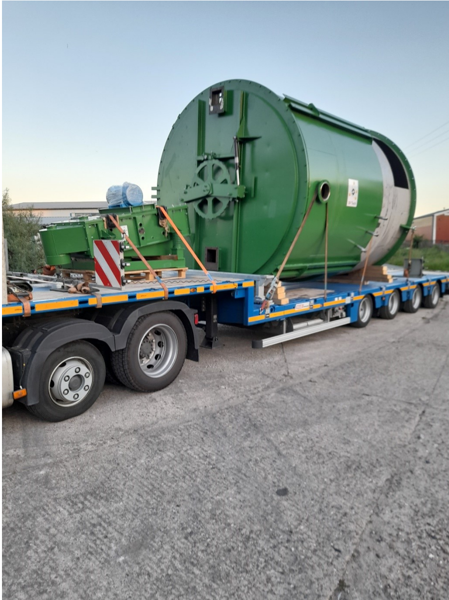
REFORMÉR DŘEVNÍHO PLYNU A VIBRAČNÍ TŘÍDIČ Green Power RS Kokava nad Rimavicou (SK) 2020 - 2021 Výroba a dodávka zařízení podle dokumentace zákazníka Aparát pro termický rozklad dehtu obsaženého v dřevním plynu Vibrační třídění dřevouhlu